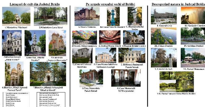
Lăcașuri de cult din Județul Brăila